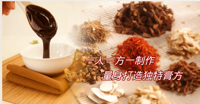
一人一方一制作 量身打造独特膏方

膏方,又称膏滋或膏剂,是医生根据患者病情、体质,经中医辨证开出处方,然后采用道地药材精心熬制,再加蜂蜜或胶类提炼为便于服用的膏剂。膏方多用于补虚扶弱、抗衰延年、纠正亚健康、防病治病,也适用于需长期服用中药的慢性病患者。膏方一年四季都可服用,滋补类膏方在冬季服用效果最佳,而治疗类膏方则一年四季皆可服用。