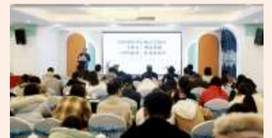
▲12月3日,医院举办全国中医药行业高等教育“十四五”创新教材《中医康养学》新书发布会。