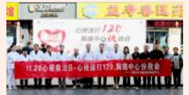
▲11月20日“1120心梗救治日”,医院在溧城街道唐家社区广场开展科普义诊活动。