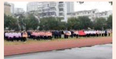
▲11月12日,医院举办第二届职工运动会。