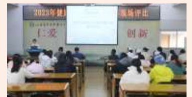
▲12月26日,互联网医院管理部联合宣传科举办“2023年健康科普微视频大赛”作品评选活动。