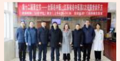
▲12月17日,医院邀请省中医院、省中医药发展研究中心、省中西医结合医院专家来院坐诊开方。