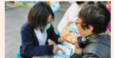
▲11月14日,内分泌科走进溧城街道昆仑花园小区开展“世界防治糖尿病日”科普义诊活动。